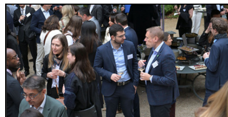
AG & Summer Party 2025