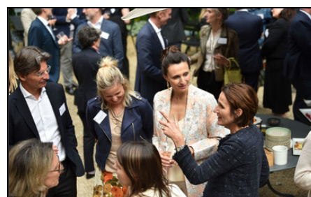
AG & Summer Party 2025

Très appréciés de nos Membres, ces rencontres 100 % réseau sont des moments privilégiés de convivialité, d'échange et de mise en relation . Qu'ils s'adressent à des communautés spécifiques ou à l'ensemble de notre réseau, ils favorisent le développement de liens professionnels durables dans un cadre informel.