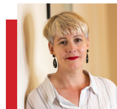
Camille Langevin Communication