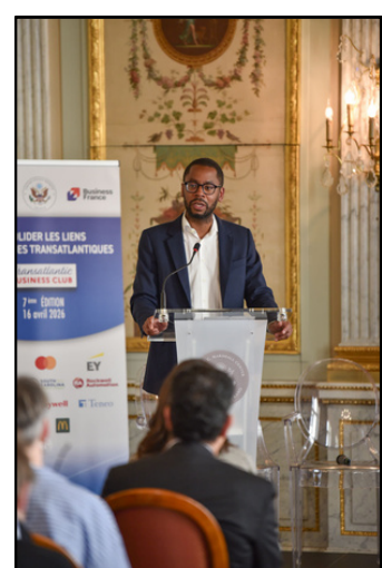
Transatlantic Business Club 2026