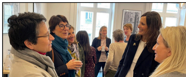
Women Leaders Breakfast