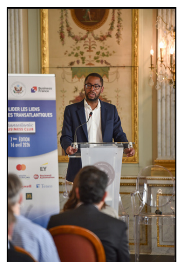
Transatlantic Business Club 2026