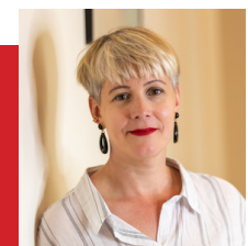
Camille Langevin Communication