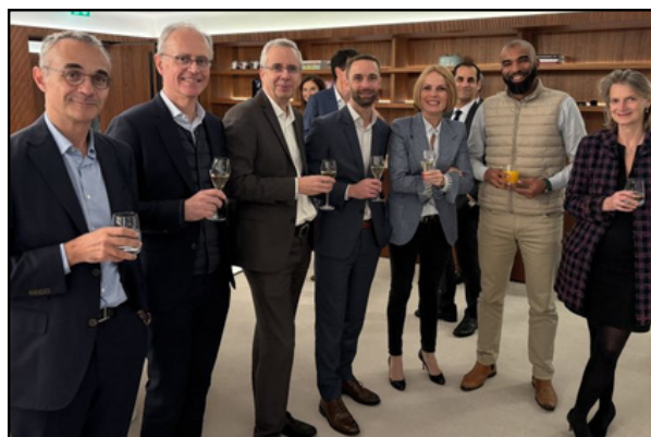
Patron only/ Gathering