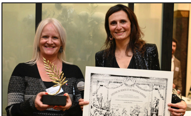
L'AmCham France distinguée par le Comité de France : Palme d'Or du Mérite National 2024