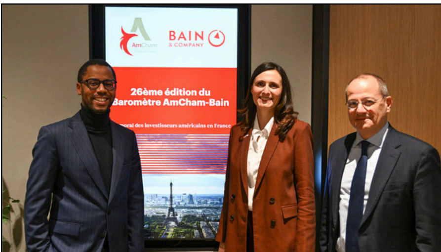
Baromètre AmCham-Bain 2026