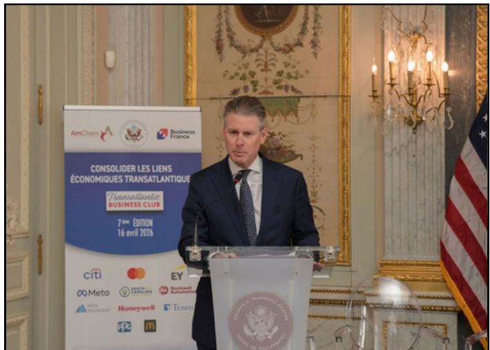
Transatlantic Business Club 2026