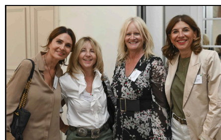
AG & Summer Party 2025

Très appréciés de nos Membres, ces rencontres 100 % réseau sont des moments privilégiés de convivialité, d'échange et de mise en relation . Qu'ils s'adressent à des communautés spécifiques ou à l'ensemble de notre réseau, ils favorisent le développement de liens professionnels durables dans un cadre informel.