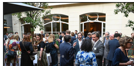
AG & Summer Party 2025