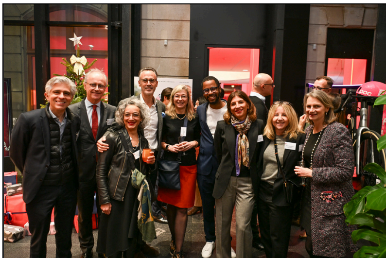
Christmas Party 2025