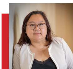
Vancheng Khou Administration et événementiel