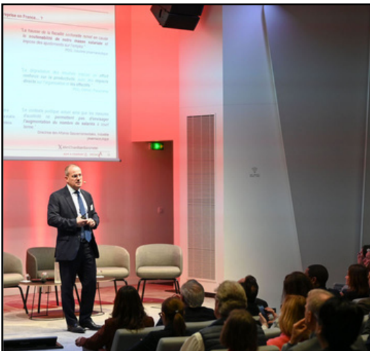
Baromètre AmCham-Bain 2026