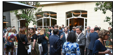
AG & Summer Party 2025