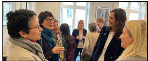
Women Leaders Breakfast