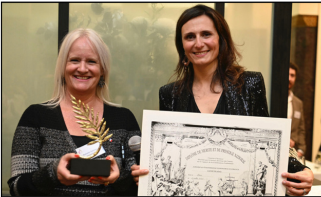
L'AmCham France distinguée par le Comité de France : Palme d'Or du Mérite National 2024