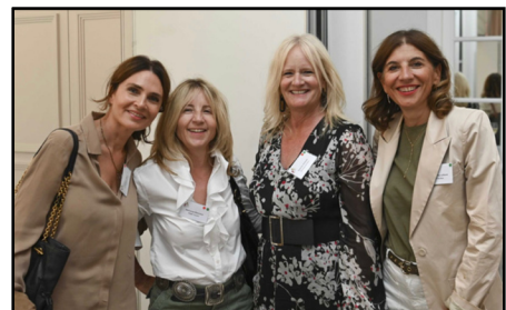
AG & Summer Party 2025

Très appréciés de nos Membres, ces rencontres 100 % réseau sont des moments privilégiés de convivialité, d'échange et de mise en relation . Qu'ils s'adressent à des communautés spécifiques ou à l'ensemble de notre réseau, ils favorisent le développement de liens professionnels durables dans un cadre informel.