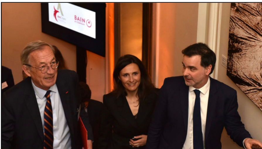
Baromètre AmCham-Bain 2025