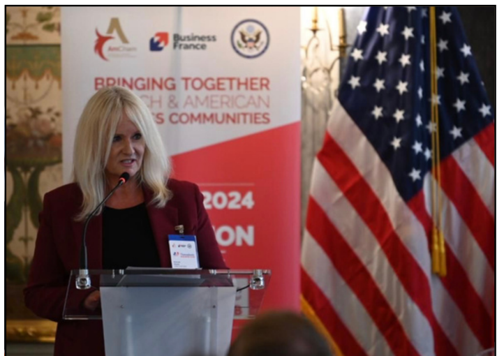
Transatlantic Business Club 2024