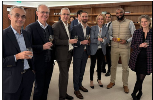
'Patron only' Gathering