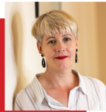
Camille Langevin Communication