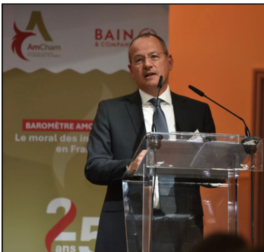
Baromètre AmCham-Bain 2025