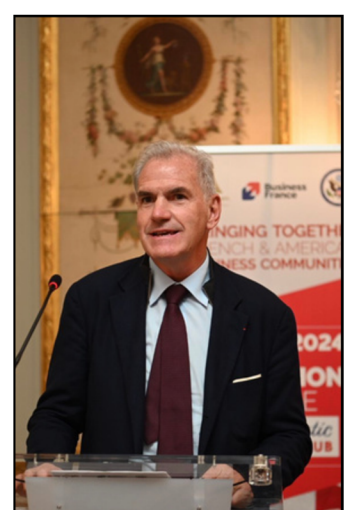
Transatlantic Business Club 2024