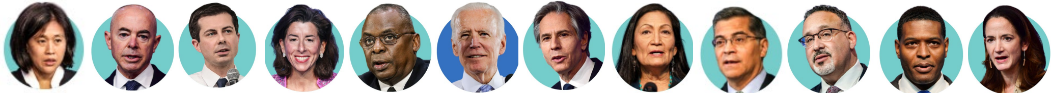
Tai Mayorkas Buttigieg Raimondo Austin Biden Blinken Haaland Becerra Cardona Regan Haines

Ce document est un PowerPoint interactif, n'hésitez pas à cliquer sur les Membres du Cabinet afin de vous diriger vers leurs présentations.